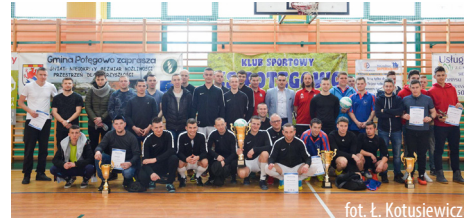
fol. Ł. Kotusiewicz

20 drużyn i ponad 200 zawodników wystąpiło w II Otwartym Turnieju Halowej Piłki Nożnej o Puchar Wójta Gminy Potęgowa. Najlepsi okazali się Błękitni Główczyce, którzy w finale pokonali po zaciętym boju zespół Nam strzelać nie kazano. Trzecie miejsce w turnieju zajęł zespół Płomienia Malczkowo.