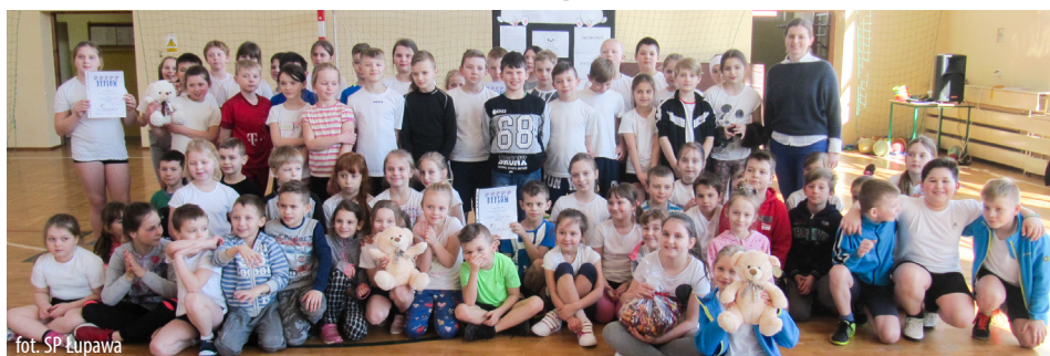
fol. SP Łupawa

Już po raz XXVIII odbył się w Szkole Podstawowej w Łupawie turniej sportowy „Biały Miś” dla klas II – IV SP.