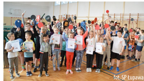
fol. SP Łupawa

22 lutego Szkoła Podstawowa w Łupawie była organizatorem kolejnego, tym razem II turnieju tenisa stołowego w ramach XII edycji Międzyszkolnej Ligi Tenisa Stołowego.